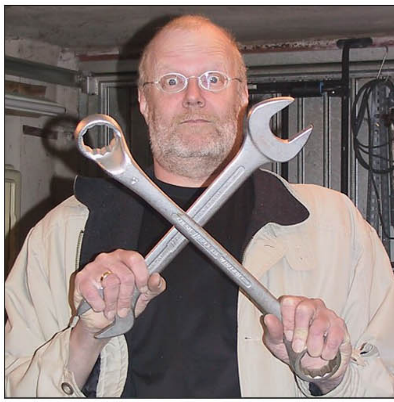
ein Ring- un ein Schraubenschlüssel