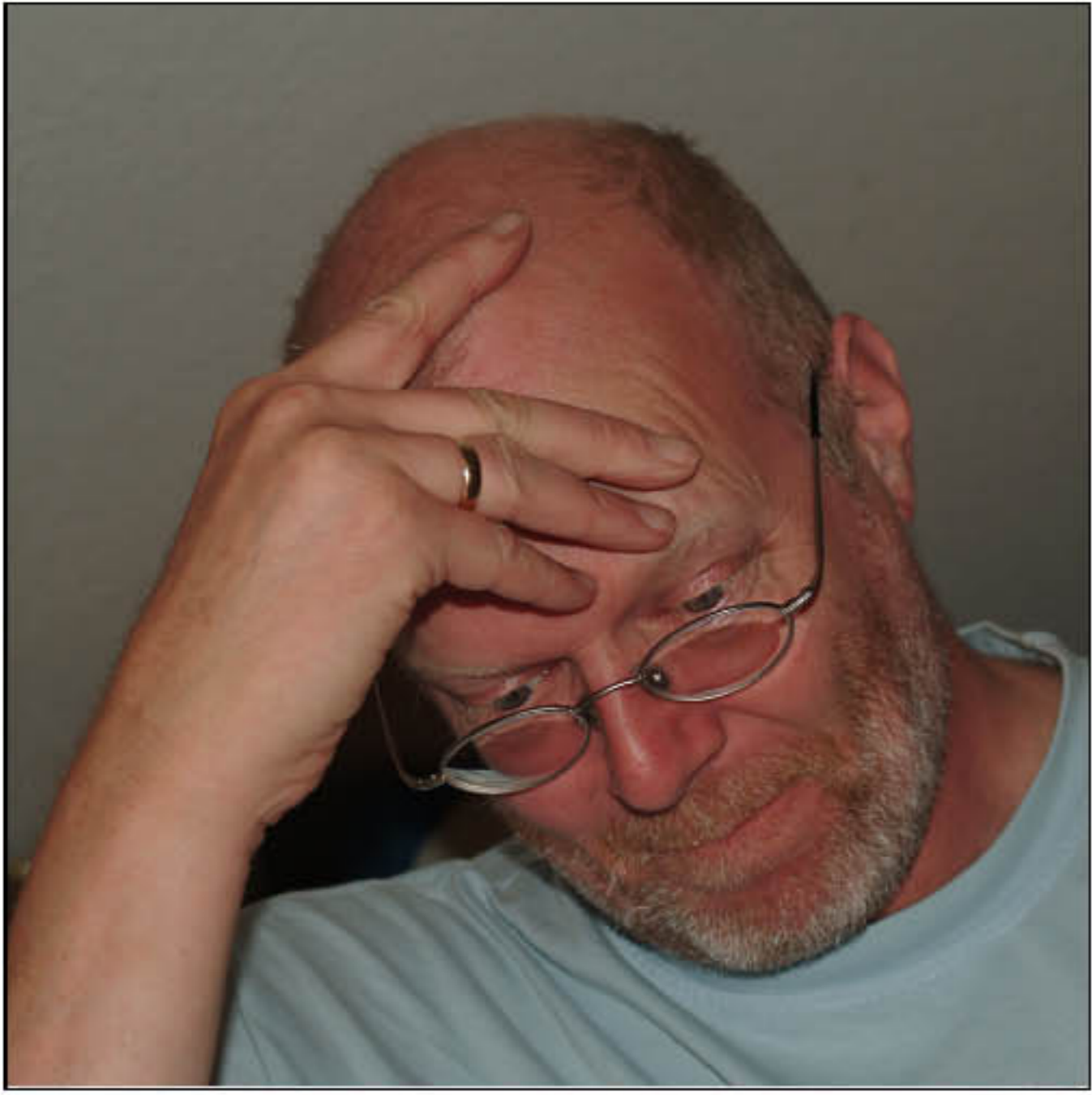
tuts auch Denken können